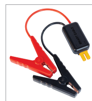
Cable de arranque inteligente