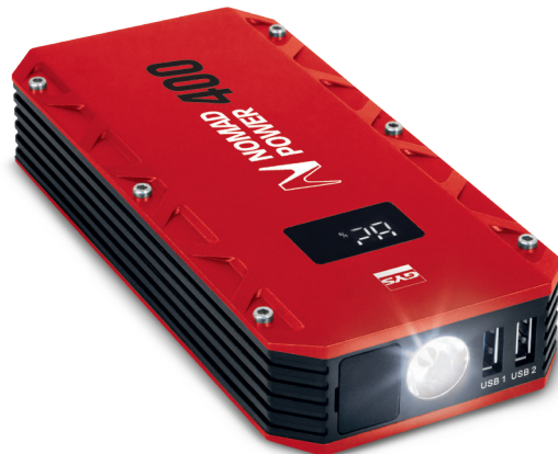
Pantalla LCD de color

Muy ligero (498 g) y compacto , se puede guardar fácilmente en la guantera o en una bolsa de viaje.